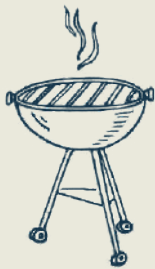
zona de parrillas