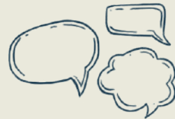
sala de recreación